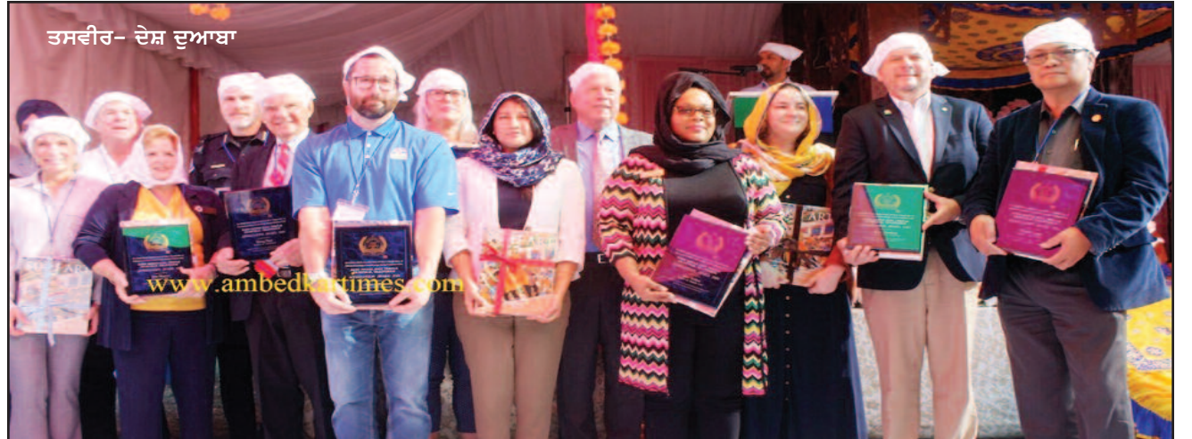
ਸ੍ਰੀ ਗੁਰੂ ਨਾਨਕ ਦੇਵ ਜੀ ਦਾ 550ਵਾਂ ਪ੍ਰਕਾਸ਼ ਦਿਹਾੜਾ ਗੁਰੂ ਨਾਨਕ ਸਿੱਖ ਟੈਪਲ ਫੇਅਰਫੀਲਡ ਵਿਖੇ ਸ਼ਰਧਾ ਅਤੇ ਉਤਸ਼ਾਹ ਨਾਲ ਮਨਾਇਆ ਗਿਆ। ਇਸ ਮੌਕੇ ਪਹੁੰਚੀਆਂ ਸ਼ਖਸੀਅਤਾਂ ਦਾ ਸਨਮਾਨ ਕਰਦੇ ਹੋਏ। (ਰਿਪੋਰਟ ਅਤੇ ਤਸਵੀਰਾਂ ਅਗਲੇ ਅੰਕ ਵਿਚ ਦੇਖੋ)