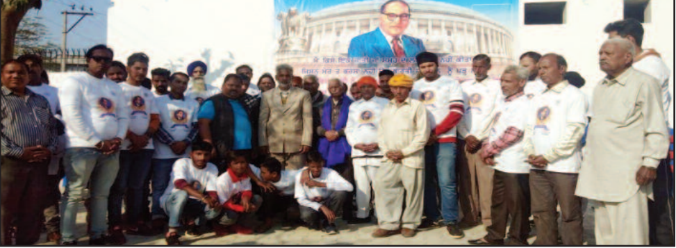
ਬਾਬਾ ਸਾਹਿਬ ਡਾ: ਅੰਬੇਡਕਰ ਜੀ ਦੇ ਪ੍ਰੀਨਿਰਵਾਣ ਦਿਵਸ ਨੂੰ ਸਮਰਪਿਤ ਸਾਈਕਲ ਮਾਰਚ ਜੋ ਕਿ ਪਿੰਡ ਕੂਪਰ ਦੇਪੁਰ ਅੱਡਾ ਕਠਾਰ ਤੇ ਆਸ ਪਾਸ ਦੇ ਨੌਜਵਾਨ ਵੀਰਾਂ ਵੱਲੋਂ ਉਲੀਕਿਆ ਗਿਆ ਸੀ, ਦੀਆਂ ਕੁਝ ਝਲਕੀਆਂ। ਮਾਰਚ ਵਿਚ ਸ਼ਾਮਿਲ ਬਜ਼ੁਰਗ ਨੌਜਵਾਨ ਤੇ ਬੱਚਿਆਂ ਵਲੋਂ 5 ਘੰਟੇ ਚ ਤਕਰੀਬਨ 25 ਕਿਲੋਮੀਟਰ ਤੇ 15 ਪਿੰਡ ਸਾਈਕਲ ਚਲਾ ਕੇ ਬਾਬਾ ਸਾਹਿਬ ਜੀ ਦੀ ਸੋਚ ਨੂੰ ਘਰ ਘਰ ਪਹੁੰਚਾਉਣ ਦਾ ਅਸਾਧਾਰਨ ਯਤਨ ਵਾਕਈ ਕਾਬਿਲ ਏ ਤਾਰੀਫ਼ ਰਿਹਾ। ਹਰ ਉਸ ਸ਼ਖ਼ਸ ਦਾ ਦਿਲ ਦੀਆਂ ਗਹਿਰਾਈਆਂ ਤੋਂ ਧੰਨਵਾਦ ਕਰਦੇ ਹਾਂ, ਜੋ ਇਸਦਾ ਹਿੱਸਾ ਰਹੇ।