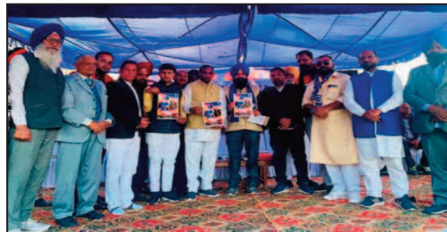
ਬਹੁਜਨ ਸਮਾਜ ਪਾਰਟੀ ਵਲੋਂ ਬਾਬਾ ਸਾਹਿਬ ਭੀਮ ਰਾਓ ਅੰਬੇਡਕਰ ਜੀ ਦੇ ਪ੍ਰੀਨਿਰਵਾਣ ਦਿਵਸ ਜਲੰਧਰ ਪਾਰਟੀ ਦਫਤਰ ਵਿਖੇ ਮਨਾਇਆ ਗਿਆ ਜੋ ਕਿ ਇੱਕ ਵਿਸ਼ਾਲ ਰੈਲੀ ਦਾ ਰੂਪ ਧਾਰਨ ਕਰ ਗਿਆ। ਏਸ ਮੌਕੇ ਤੇ ਨਵੇਂ ਗੀਤ ਅੱਣਖੀ ਯੋਧੇ ਦਾ ਪੋਸਟਰ ਰਿਲੀਜ਼ ਕੀਤਾ ਗਿਆ।

ਮੇਰੇ ਕੋਲ ਆਪਣੀ ਮੁਹਿੰਮ ਚਲਾਉਣ ਲਈ ਪੈਸਾ ਨਹੀਂ ਹੈ। ਜਿਉਂ ਜਿਉਂ ਮੁਹਿੰਮ ਅੱਗੇ ਵਧ ਰਹੀ ਹੈ, ਪੈਸਾ ਜੁਟਾਉਣਾ ਮੁਸ਼ਕਿਲ ਹੁੰਦਾ ਜਾ ਰਿਹਾ ਹੈ।' ਭਾਰਤੀ ਮੂਲ ਦੇ ਕੈਂਸਰ ਖੋਜੀ ਸਵਰਗੀ ਸ਼ਿਆਮਲਾ ਗੋਪਾਲਨ ਦੀ ਧੀ ਹੈਰਿਸ ਨੇ ਆਪਣੇ ਹਮਾਇਤੀਆਂ ਦਾ ਧੰਨਵਾਦ ਕਰਦਿਆਂ ਕਿਹਾ ਹੈ ਕਿ ਉਹ ਅੱਜ ਤੋਂ ਹੀ ਆਪਣੀ ਮੁਹਿੰਮ ਰੋਕ ਰਹੀ ਹੈ।