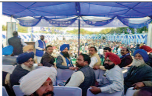
ਸੈਨ ਨੇ ਬਾਬਾ ਸਾਹਿਬ ਨੂੰ ਅਰਥ ਸ਼ਾਸਤਰ ਵਿਸ਼ੇ 'ਤੇ ਆਪਣਾ ਪਿਤਾ ਮੰਨਿਆ।