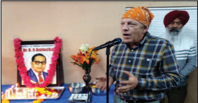
ਸ੍ਰੀ ਗੁਰੂ ਰਵਿਦਾਸ ਟੈਪਲ ਰਿਓ ਲਿੰਡਾ ਵਿਖੇ ਡਾ. ਅੰਬੇਡਕਰ ਜੀ ਨੂੰ ਪ੍ਰੀਨਿਰਵਾਣ ਦਿਵਸ 'ਤੇ ਨਿੱਘੀਆਂ ਸ਼ਰਧਾਂਜਲੀਆਂ ਭੇਟ ਕੀਤੀਆਂ ਗਈਆਂ। (ਰਿਪੋਰਟ ਅਤੇ ਤਸਵੀਰਾਂ ਦੇਖੋ ਸਫ਼ਾ 15 'ਤੇ)

ਸ੍ਰੀ ਗੁਰੂ ਨਾਨਕ ਦੇਵ ਜੀ ਦੇ 550ਵੇਂ ਪ੍ਰਕਾਸ਼ ਦਿਹਾੜੇ ਨੂੰ ਸਮਰਪਿਤ ਦੇਸ਼ ਦੁਆਬਾ ਦਾ ਪ੍ਰਥਮ ਪੰਨਵਾਦ ਸਮਾਗਮ 21 ਦਸੰਬਰ, 2019 ਦਿਨ ਸ਼ਨਿਚਰਵਾਰ ਨੂੰ (ਹੋਰ ਜਾਣਕਾਰੀ ਲਈ ਦੇਖੋ ਸਫ਼ਾ 11)